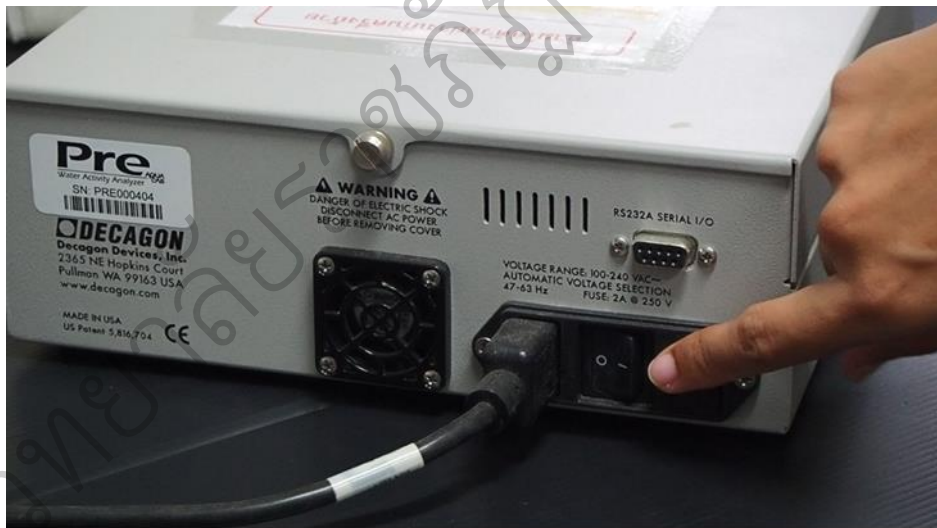
รูป 4.1 ตัวอย่างวิดิทัศน์ เรื่อง วิธีการใช้เครื่องวัดปริมาณน้ำอิสระ

วิดิทัศน์ เรื่อง วิธีการใช้เครื่องวัดปริมาณน้ำอิสระ ที่ผู้วิจัยได้พัฒนาขึ้นมาอยู่ในรูปแบบของดิจิทัลนำเสนอเนื้อหาขั้นตอนการใช้งานเครื่องวัดปริมาณน้ำอิสระ การอ่านค่า และการดูแลรักษาเครื่องมือ โดยมีวิธีการให้ความรู้ในรูปแบบวิดิทัศน์ที่เป็นรายการสาธิต