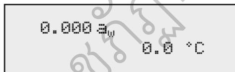
รูป 2.3 หน้าจอแสดงผลของเครื่อง Aw หลังเปิดเครื่อง

ซึ่งตัวเลขที่ตำแหน่งบนซ้ายแสดงถึงค่าปริมาณน้ำอิสระ หรือค่า aw และตัวเลขด้านล่างแสดงอุณหภูมิของตัวอย่าง