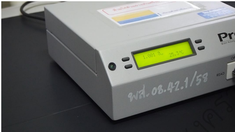
รูป 4.4 ตัวอย่างวีดิทัศน์ เรื่อง วิธีการใช้เครื่องวัดปริมาณน้ำอิสระ