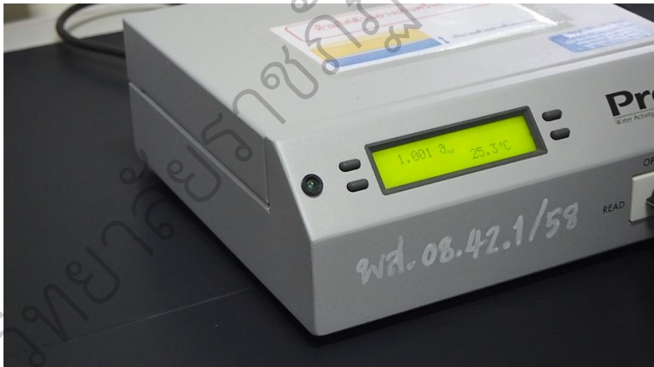
รูป 4.5 ตัวอย่างวีดิทัศน์ เรื่อง วิธีการใช้เครื่องวัดปริมาณน้ำอิสระ