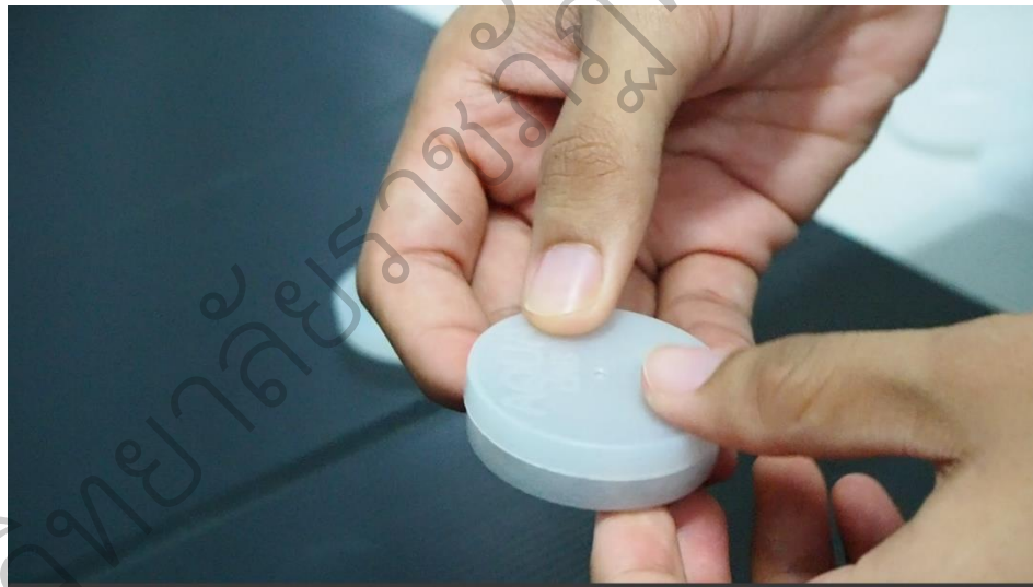
รูป 4.7 ตัวอย่างวิธีทัศน์ เรื่อง วิธีการใช้เครื่องวัดปริมาณน้ำอิสระ