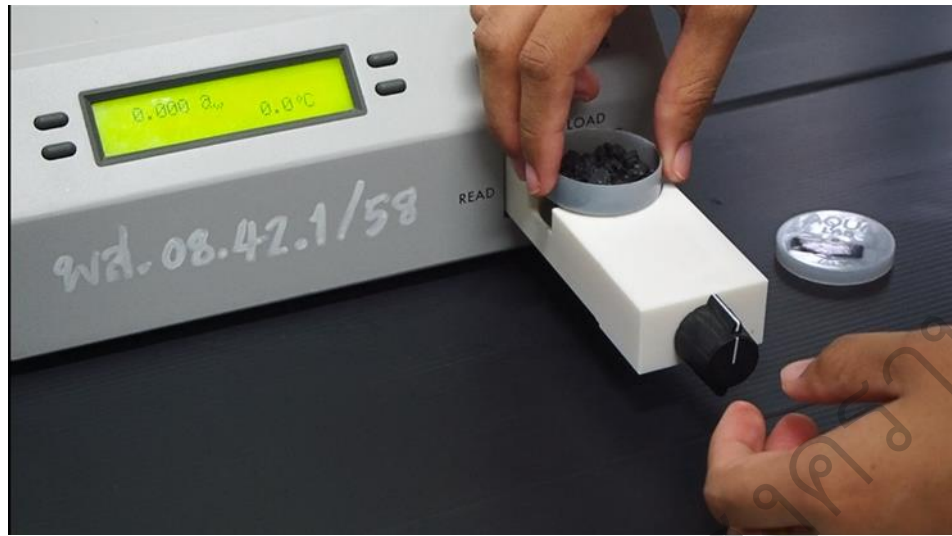
รูป 4.2 ตัวอย่างวีดิทัศน์ เรื่อง วิธีการใช้เครื่องวัดปริมาณน้ำอิสระ