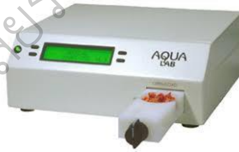
รูป 2.1 เครื่องวัดค่า Water Activity รุ่น AquaLab Pre

ค่า water activity มีค่า ตั้งแต่ 0 ถึง 1