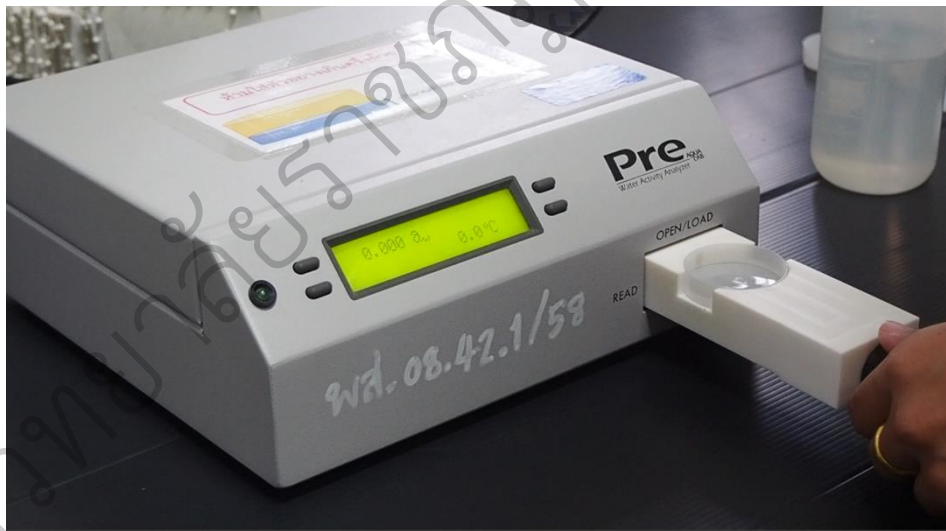
รูป 4.3 ตัวอย่างวีดิทัศน์ เรื่อง วิธีการใช้เครื่องวัดปริมาณน้ำอิสระ