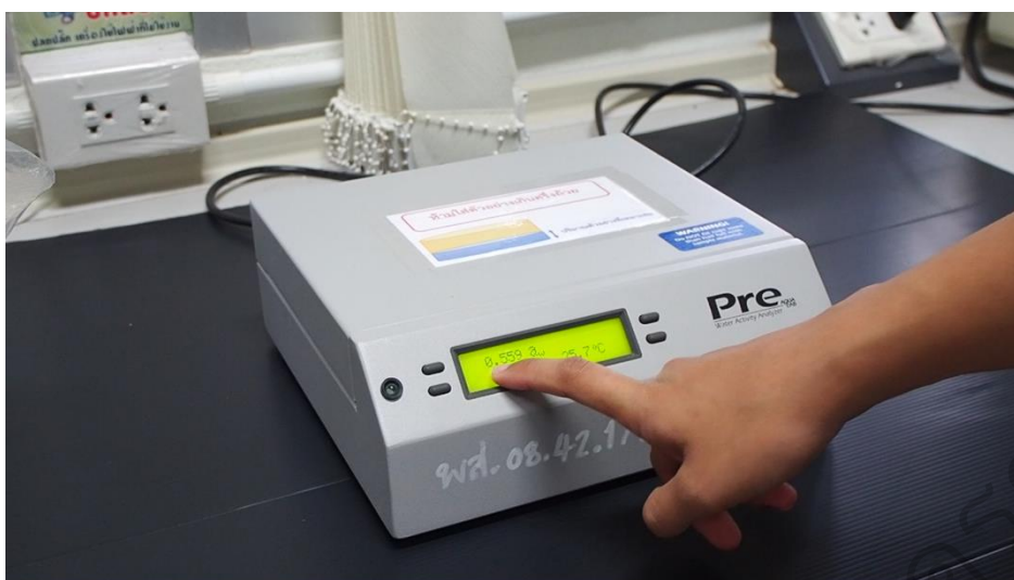
รูป 4.8 ตัวอย่างวีดิทัศน์ เรื่อง วิธีการใช้เครื่องวัดปริมาณน้ำอิสระ