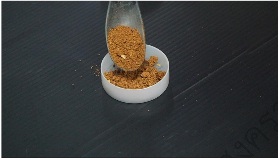
รูป 4.6 ตัวอย่างวิธีทัศน์ เรื่อง วิธีการใช้เครื่องวัดปริมาณน้ำอิสระ