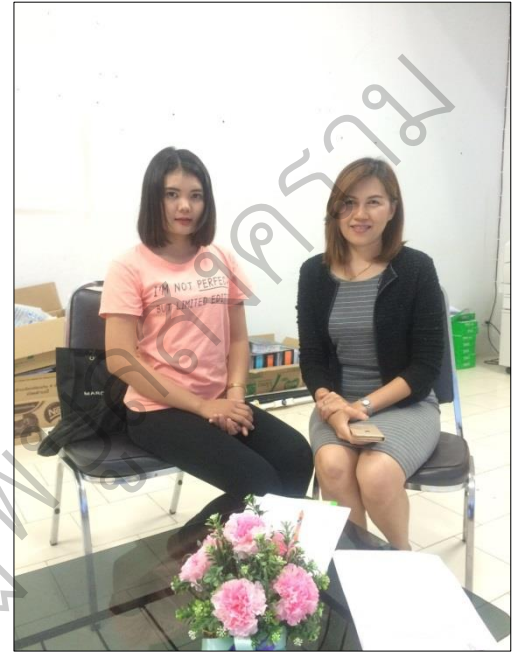
ภาพที่ 1.8 แสดงการสัมภาษณ์ตัวแทนนักศึกษาหอพักที่เข้าร่วมกิจกรรมหอพัก