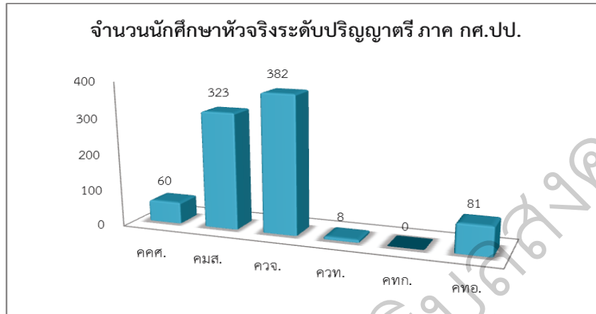
แผนภูมิที่ 1 จำนวนนักศึกษาหัวจรงิภาพรวมของมหาวิทยาลัยในระดับปริญญาตรีภาค กศ.ปป.

จากตารางที่ 2 พบว่า จำนวนนักศึกษาหัวจรงิภาพรวมในระดับปริญญาตรีภาค กศ.ปป. ในปีการศึกษา 2558 มากที่สุดคือ คณะวิทยาการจัดการ จำนวน 382 คน คิดเป็นร้อยละ 44.73 รองลงมาคือ คณะมนุษยศาสตร์และสังคมศาสตร์ จำนวน 323 คน คิดเป็นร้อยละ 37.82 และคณะที่มีนักศึกษาหัวจรงิที่ลงทะเบียนเรียนน้อยที่สุด คือ คณะวิทยาศาสตร์และเทคโนโลยีจำนวน 8 คน คิดเป็นร้อยละ 0.94 แสดงได้ดังแผนภูมิที่ 1