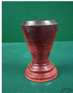
ภาพที่ 15 รูปแบบที่ 1 ภาพกล่องมังคละที่ระลึกจำลอง

รูปแบบและรูปทรงของกล่องมังคละจำลองที่พัฒนาต้นแบบที่ระลึกพร้อมบรรจุภัณฑ์โดย สัมภาษณ์ผู้ใช้ผลิตภัณฑ์กล่องมังคละที่ระลึก โดยมีรูปแบบที่ดังแสดงในภาพต่อไปนี้