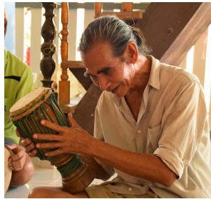
ภาพที่ 12 ภาพกลองม้งคละในอดีตของจังหวัดอุดรดิตถ์