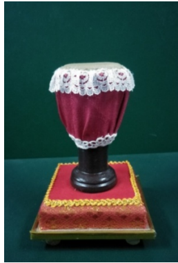
ภาพที่ 17 รูปแบบที่ 3 ภาพกลองม้งคละที่ระลึกจำลอง