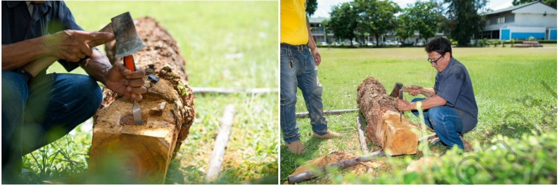
ภาพที่ 20 ขั้นตอนการเตรียมวัสดุได้แก่ ไม้ขนุน