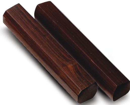
ภาพที่ 7 กรับ