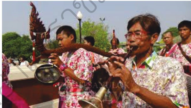
ภาพที่ 8 คานหามรูปพญานาค

คานหามที่ใช้ในวงม้งคละมีลักษณะโค้งเพื่อให้รับกับป่าของคานหาม มีไว้สำหรับแขวนฆ้องจำนวน 3 ใบ คือฆ้องหน้า 1 ใบ ฆ้องหลัง 2 ใบ ตีให้จังหวะเพลง วงม้งคละบางวงคานหามอาจเป็นรูปจระเข้ หรือรูปพญานาค