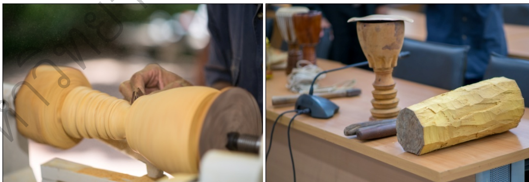
ภาพที่ 22 กลองมังคละจำลองที่ระลึกที่กลึงเสร็จแล้ว