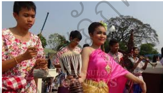
ภาพที่ 1 กลองม้งคละ

การบรรเลงม้งคละจะใช้คน 2 คน คนหนึ่งเป็นผู้ถือกลองคอยร่ายป้อไปมา อีกคนหนึ่งถือหวายข้างละมือเดินตีกลองรัวตามไป เสียงของกลองม้งคละดังชัดเจนกว่าเครื่องดนตรีชนิดอื่น ๆ ในวง คนตีก็ต้องแสดงออกด้วยท่าทางและลีลาตามแบบศิลปะพื้นบ้านคล้ายกับวงกลองพื้นเมืองทั่วไป