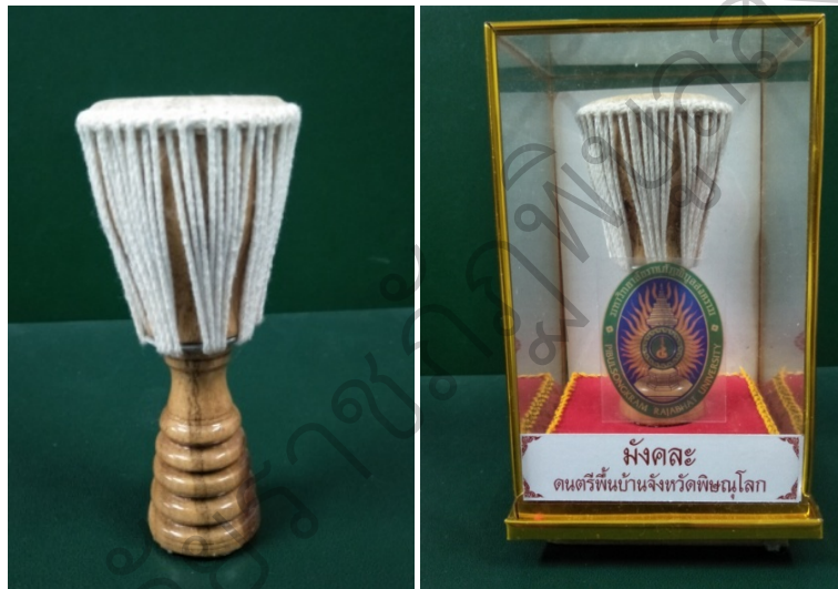
ภาพที่ 24 กลองม้งคละจำลองที่ระลึกที่สำเร็จพร้อมใช้งาน