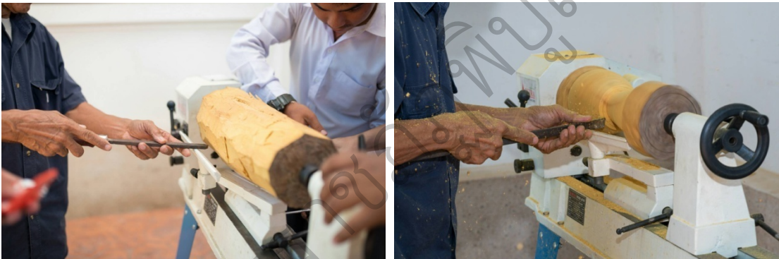
ภาพที่ 21 ขั้นตอนการกลึงกลองมังคละจำลองที่ระลึกที่ออกแบบไว้