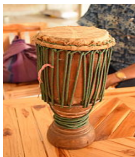
ภาพที่ 11 ภาพกลองม้งคละในอดีตของจังหวัดสุโขทัย