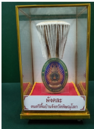
ภาพที่ 19 ภาพกลองม้งคละที่ระลึกจำลองสำเร็จรูป