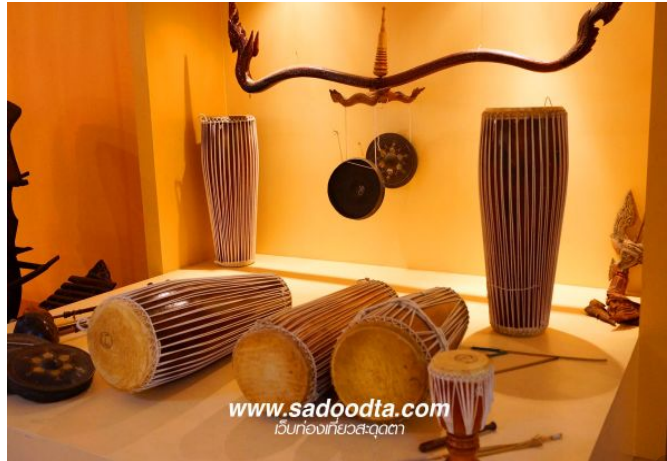
ภาพที่ 2 กลองยี่น