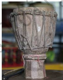
ภาพที่ 10 ภาพกลองม้งคละในอดีตของจังหวัดพิษณุโลก

รูปแบบและรูปทรงของกลองม้งคละในอดีตที่สำคัญๆ โดยมีรูปแบบที่เป็นเอกลักษณ์ของจังหวัดพิษณุโลกผู้วิจัยได้นำรูปแบบเหล่านั้นมาประยุกต์และพัฒนาเพื่อเป็นต้นแบบผลิตภัณฑ์กลองม้งคละจำลองที่ระลึกพร้อมบรรจุภัณฑ์โดยจะนำไปประกอบในแบบสอบถามและแบบสัมภาษณ์ผู้ใช้ผลิตภัณฑ์กลองม้งคละที่ระลึกดังแสดงในภาพต่อไปนี้