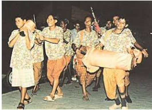
ภาพที่ 9 ขบวนแห่ดนตรีพื้นบ้านม้งคละในงานพิธีต่างๆ