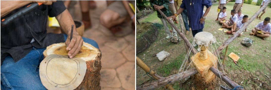
ภาพที่ 23 การชิงหน้ากลองม้งคละจำลองที่ระลึก