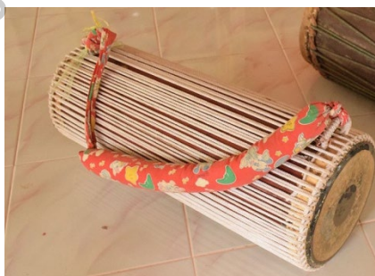
ภาพที่ 3 กลองหลอน

เป็นกลองขนาดใหญ่ ลักษณะเป็นกลอง 2 หน้า มีลักษณะเช่นเดียวกับกลองยี่น แต่มีขนาดย่อมกว่าเล็กน้อย ตัวกลองทำด้วยไม้ขนุนหรือไม้เนื้อแข็งอย่างอื่น ขนาดหน้ากลองหน้ากว้าง 23 ซม. หน้าเล็กกว้าง 16 ซม. ความยาว 79 ซม. ใช้ผ้าสีสดหรือผ้าลายดอกหุ้มหุ้มกลองโดยตลอดเพื่อความสวยงาม มีสายผูกกลองสำหรับคล้องคอในขณะเดินบรรเลง หน้ากลองเล็กใช้ตีด้วยมือให้เสียง “จ๊ะ” หน้ากลองหน้าใหญ่ใช้ตีด้วยไม้เหลากลมๆ ความยาว 20 ซม. ให้เสียง “ตึง” กลองหลอนในวงม้งคละ โดยทั่ว ๆ ไป ใช้ใบเดียวทำหน้าที่ตีซัดและหยอกล้อกับกลองยี่น เพื่อเพิ่มพยางค์ของทำนองเพลงให้ดีขึ้น