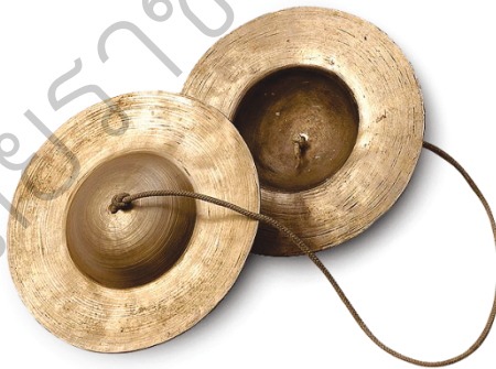
ภาพที่ 6 ฉาบ

ฉาบที่ใช้ในวงมโหรี มีลักษณะเช่นเดียวกับฉาบในวงดนตรีไทย ใช้เป็นเครื่องประกอบจังหวะ เพื่อให้มีความครึกครื้นสนุกสนานยิ่งขึ้น ฉาบมี 2 คู่ ฉาบขนาดเล็ก เรียกว่า “ฉาบหล่อน” หรือ “ฉาบหล่อน” มีหน้าที่ตีชัดจังหวะหลอกล่อไปกับทำนองเพลง และฉาบขนาดใหญ่ เรียกว่า “ฉาบยี่น” มีหน้าที่ตียี่นจังหวะหลัก