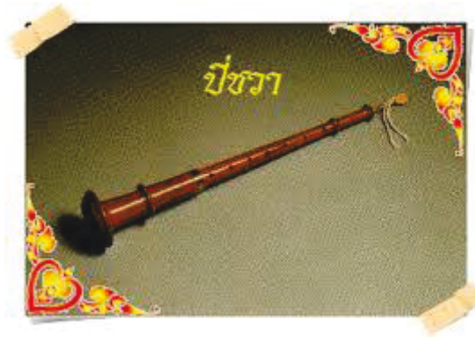
ภาพที่ 5 เป็ชวา