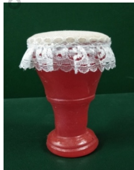
ภาพที่ 16 รูปแบบที่ 2 ภาพกล่องมังคละที่ระลึกจำลอง