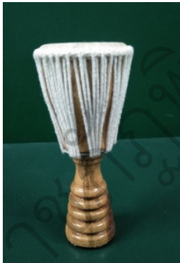
ภาพที่ 18 รูปแบบที่ 4 ภาพกลองม้งคละที่ระลึกจำลอง