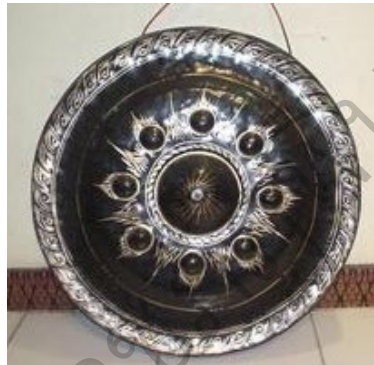
ภาพที่ 4 ฆ้อง

ส่วนฆ้องอีก 2 ใบ มีขนาดเท่ากัน เรียกว่า “ฆ้องโหม่ง” หรือ “ฆ้องหลัง” แขวนไว้บนคานหามคู่กันคนละข้าง ใช้ไม้ตีเพื่อให้จังหวะ ช่างละ 1 ครั้ง ก็กลับกันไป คานหามที่ใช้แขวนฆ้อง 3 ใบ จะมีการประดิษฐ์ตกแต่งเป็นรูปสัตว์ต่างๆ เช่น รูปพญานาค จระเข้ ปลา หรือรูปเทวดา ฯลฯ นอกจากนี้ยังมีการลงรักปิดทองเพื่อความสวยงาม