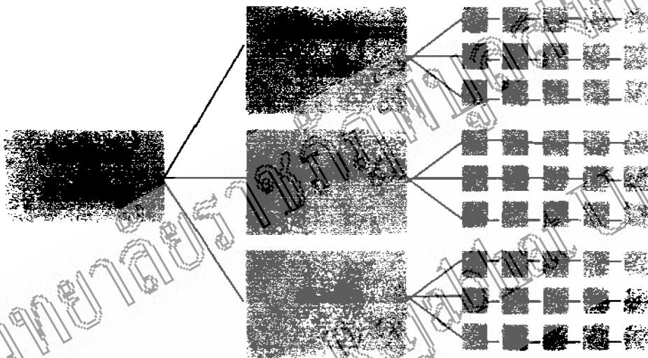
แผนภูมิ 3 ระบบทฤษฎีใหม่ที่สมบูรณ์ อ่างใหญ่ เต็มอ่างเล็ก อ่างเล็ก เต็มสระน้ำ

การที่จะทำให้ทฤษฎีใหม่สมบูรณ์ได้นั้นก็คือ สระเก็บกักน้ำจะต้องทำหน้าที่ได้อย่างมีประสิทธิภาพและเต็มความสามารถ โดยต้องมีแหล่งน้ำขนาดใหญ่ที่สามารถเพิ่มเติมน้ำในสระเก็บกักน้ำให้เต็มอยู่เสมอ ดังเช่นในกรณีของการทดลองที่วัดมงคลชัยพัฒนา จังหวัดสระบุรี ซึ่งพระบาทสมเด็จพระเจ้าอยู่หัว ทรงเสนอวิธีการดังแสดงในแผนภูมิ 3