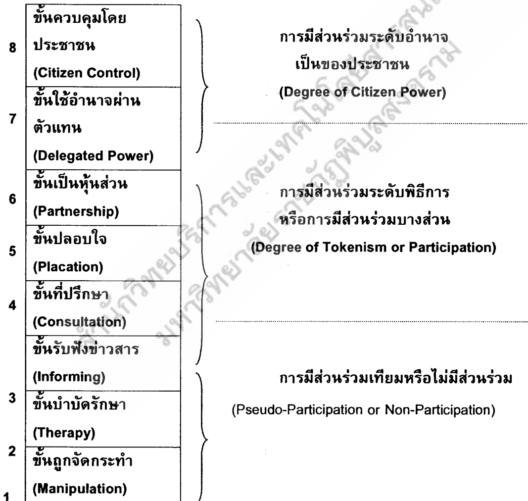
ภาพที่ 3 แสดงบันไดของลักษณะการมีส่วนร่วม

แอมสไตน์ (Arm stein) มีความเห็นว่าการมีส่วนร่วมมีลักษณะเป็นบันได (Participation Ladder) 8 ขั้น แสดงไว้ดังภาพ