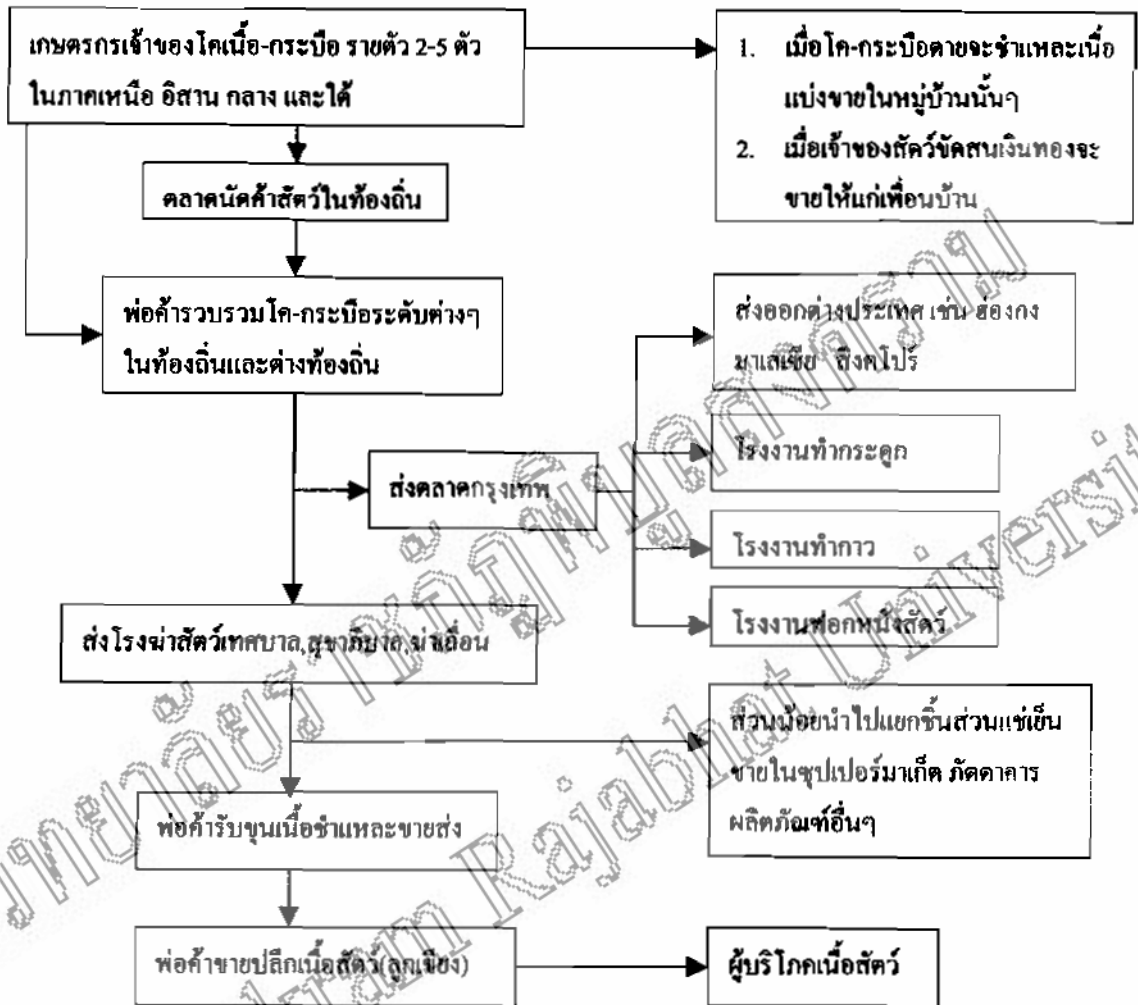
ภาพที่ 1 แสดงวิธีการตลาดโคเนื้อ-กระบือ ในประเทศไทย

การตลาดเป็นปัจจัยที่สำคัญอย่างหนึ่งในการพัฒนาการเลี้ยงสัตว์ของประเทศ ผู้ประกอบการเลี้ยงสัตว์จึงต้องมีความรู้ ความเข้าใจด้านการตลาดจึงจะประสบความสำเร็จในการเลี้ยงสัตว์ ได้ผลกำไร และสามารถขยายกิจการของคนได้ โดยทั่วไป การตลาดสัตว์เศรษฐกิจต่างๆ มีหลักการคล้ายคลึงกัน แต่จะมีความแตกต่างกันในรายละเอียด สำหรับตลาดโค และกระบือในปัจจุบันเป็นตลาดขายโคเนื้อ-กระบือที่มีชีวิต ตลาดเนื้อสดและผลิตภัณฑ์ โดยวิธีการตลาดเป็น ดังภาพที่ 1