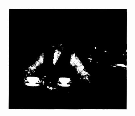
บทสนทนา Conversation: Fruit juice, tea, coffee and water (เครื่องดื่ม น้ำผลไม้ น้ำชา กาแฟ และ น้ำ)