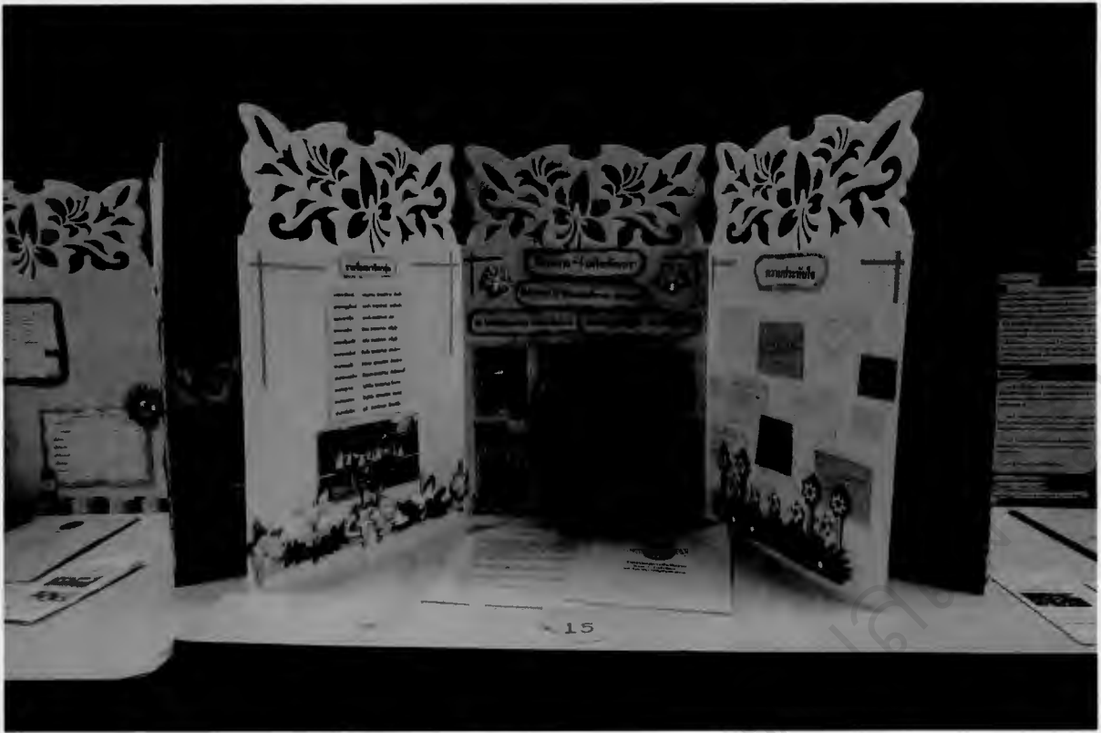
โชว์ผลงาน