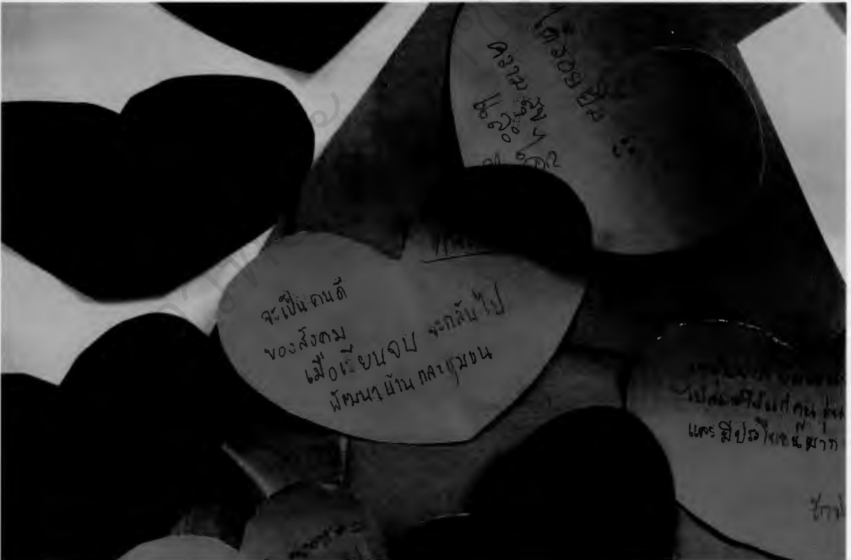
ร่วมกันเขียนบันทึกความดี