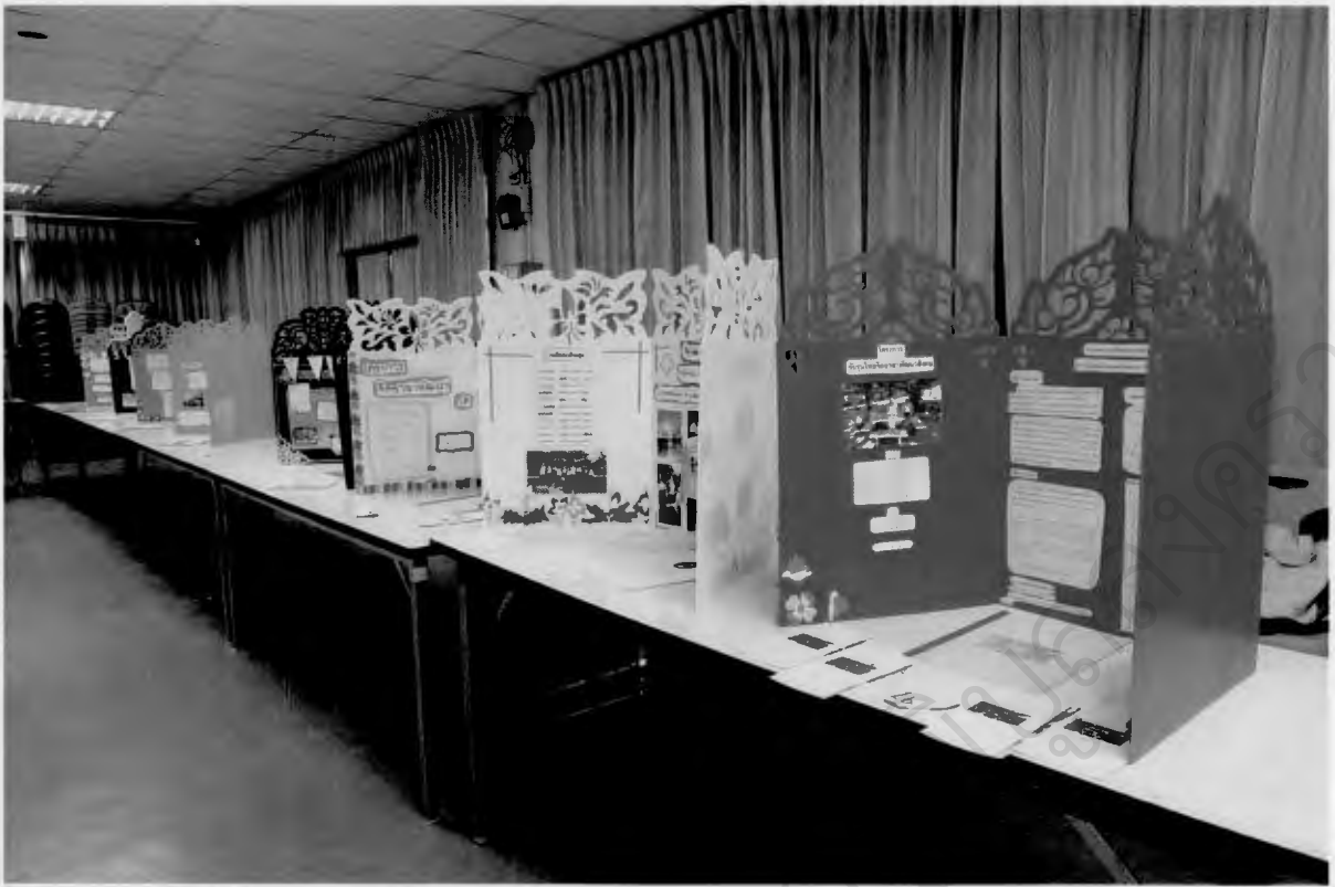
จัดนิทรรศการแสดงผลงานมีแผ่นพับแจกเพื่อน