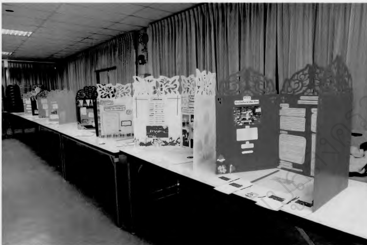
จัดนิทรรศการแสดงผลงานมีแผ่นพับแจกเพื่อน