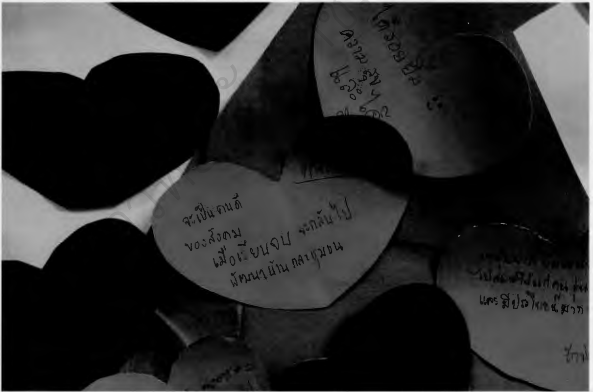
ร่วมกันเขียนบันทึกความดี