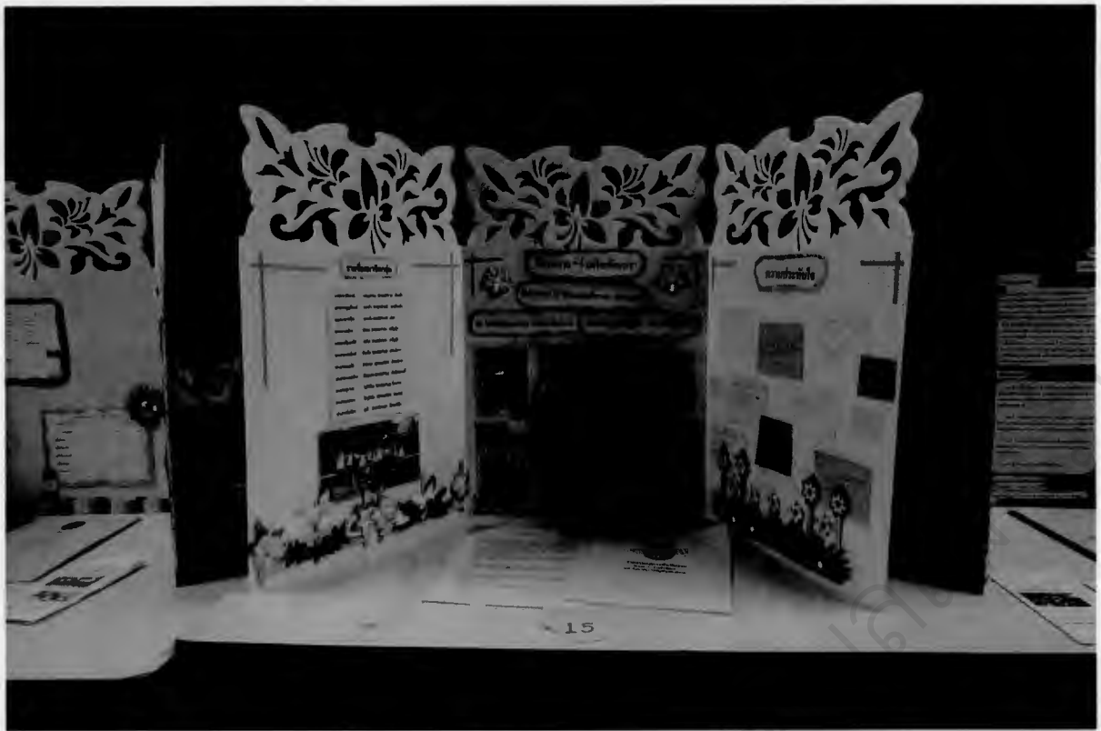
โชว์ผลงาน