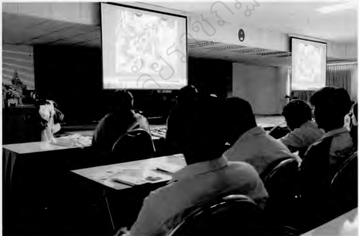
นำเสนอด้วย VDO Presentation