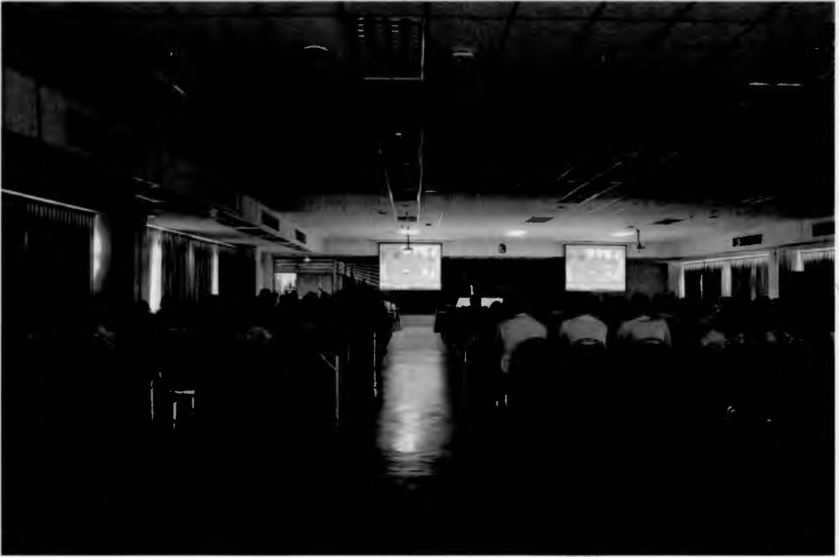
ร่วมกันประเมินผลงานกลุ่มเพื่อน