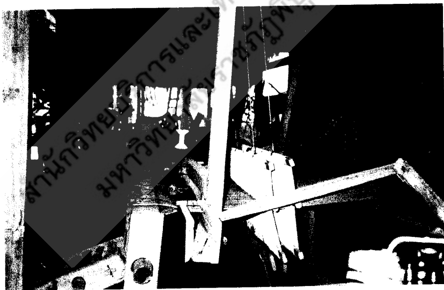
แหล่งทอผ้า ของกลุ่มอาชีพทอผ้า บ้านม่วงหอม