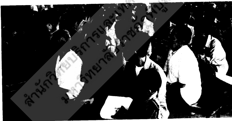
การเข้าร่วมกิจกรรมประชุมกลุ่ม