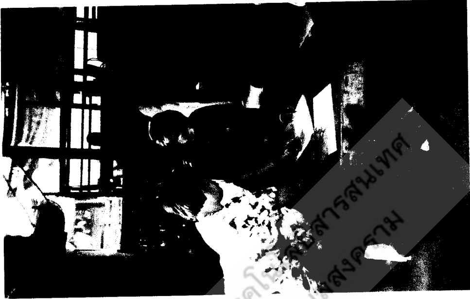
การเก็บรวบรวมข้อมูล