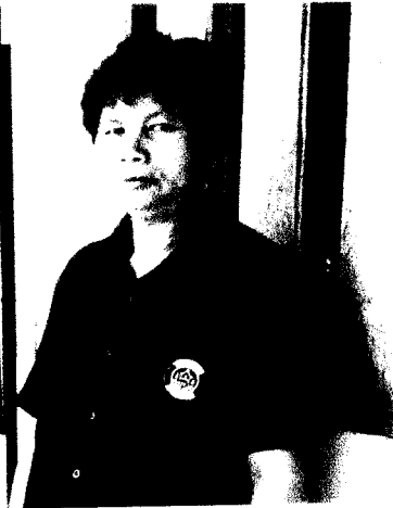
ประธานกรรมการกลุ่มอาชีพทอผ้า