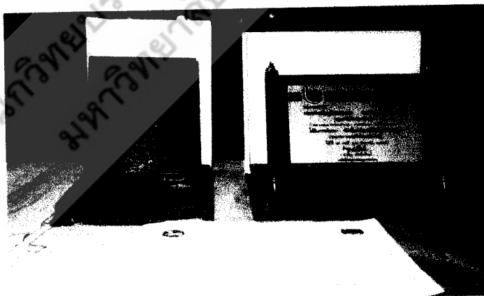
รางวัลคุณภาพ จากผ้าทอที่กลุ่มอาชีพทอผ้าบ้านม่วงหอมได้รับ