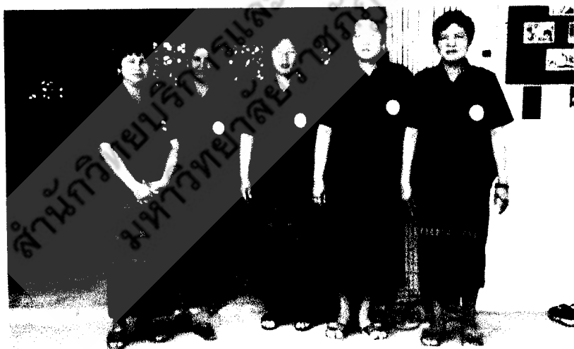
คณะกรรมการกลุ่มอาชีพทอผ้า บ้านม่วงหอม หมู่ที่ 5 ตำบลแก่งไทร อำเภอวังทอง จังหวัดพิษณุโลก