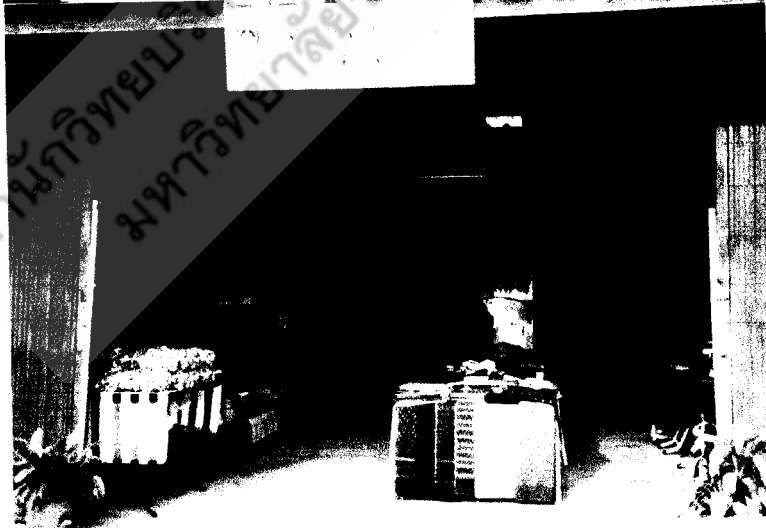
สถานที่จัดแสดงสินค้าและผลิตภัณฑ์จากผ้าทอ – การจำหน่ายผลิตภัณฑ์ ของกลุ่มอาชีพทอผ้าบ้านม่วงหอม