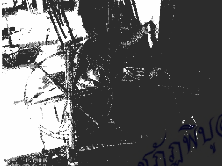
ภาพที่ 19 การนำลูกทอมาปั่นด้วยทลให้เป็นเส้นฝ้าย