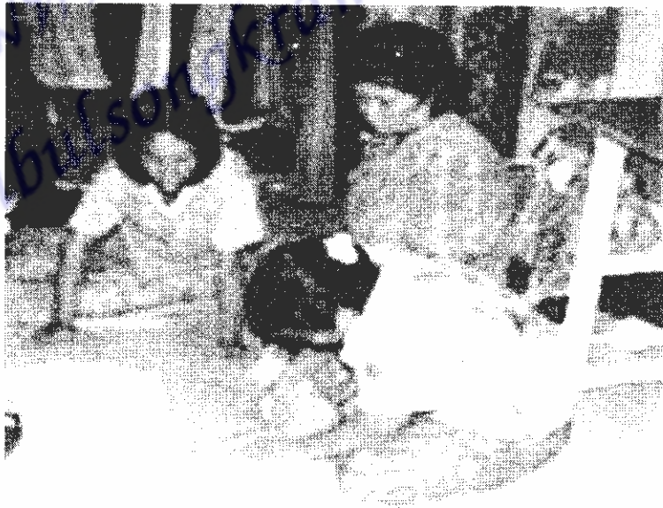
ภาพที่ 4 วิทยากรสอนการออกแบบและตัดเย็บเสื้อผ้าสำเร็จรูปให้กับสมาชิกกลุ่ม