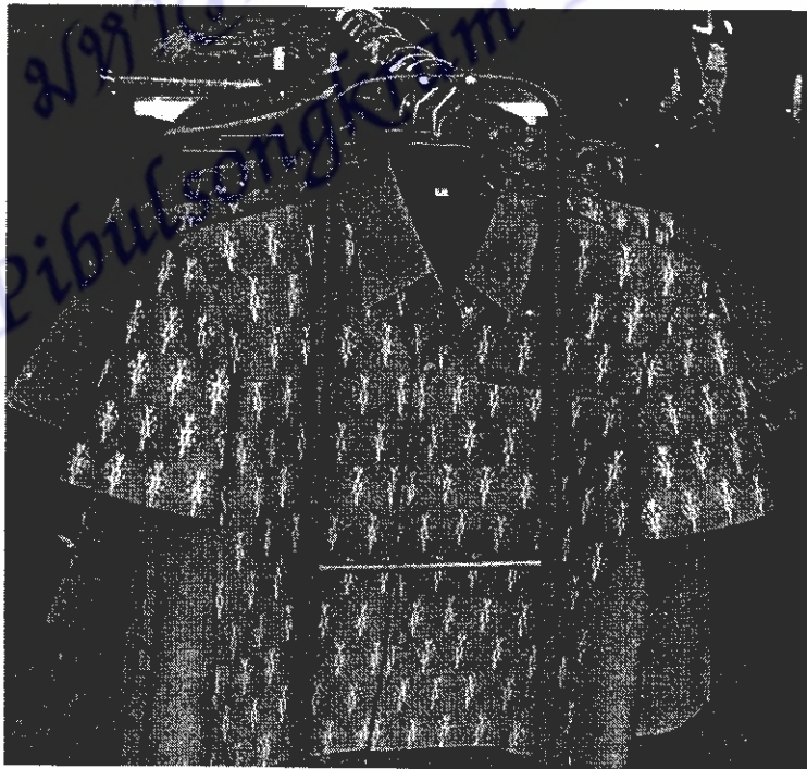
ภาพที่ 6 ผลิตภัณฑ์เสื้อผ้าสำเร็จรูปที่กลุ่มได้พัฒนาขึ้น