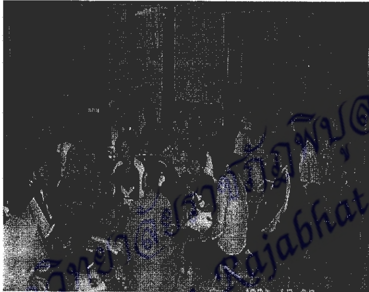
ภาพที่ 1 เป็นการประชุมกลุ่มเพื่อชี้แจงวัตถุประสงค์ของการทำวิจัย