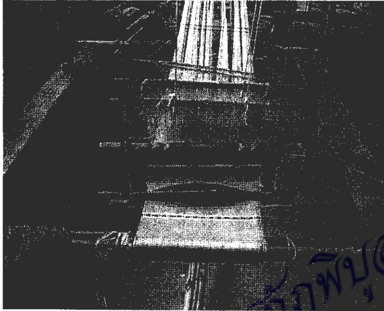
ภาพที่ 13 การทอผ้าเซ็ดหน้า