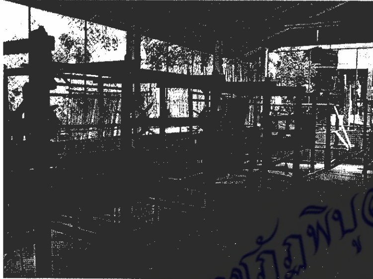
ภาพที่ 15 โรงเรือนกลุ่มทอผ้าบ้านนาพริก