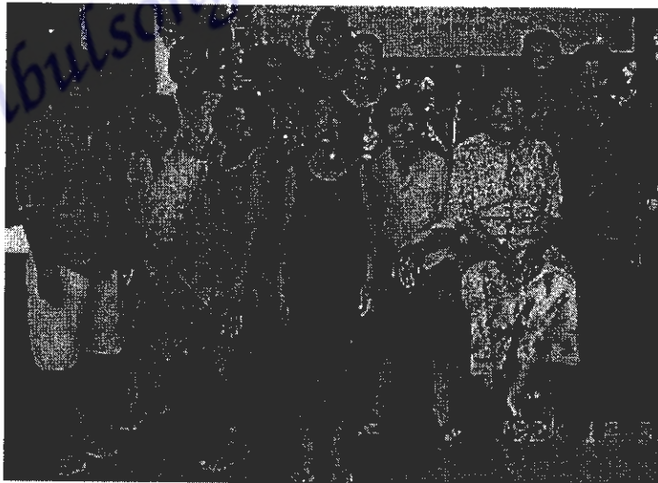
ภาพที่ 8 สมาชิกกลุ่มทอผ้าบ้านน้ำพริก