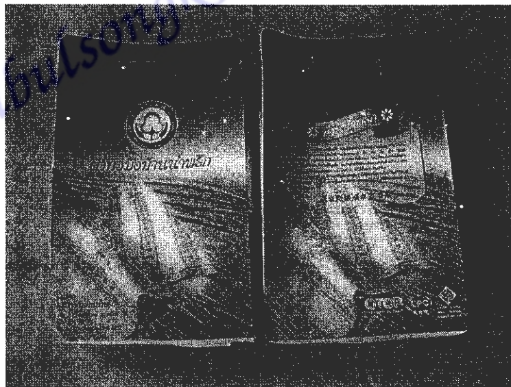
ภาพที่ 20 บรรจุภัณฑ์บ้านน้ำพริก