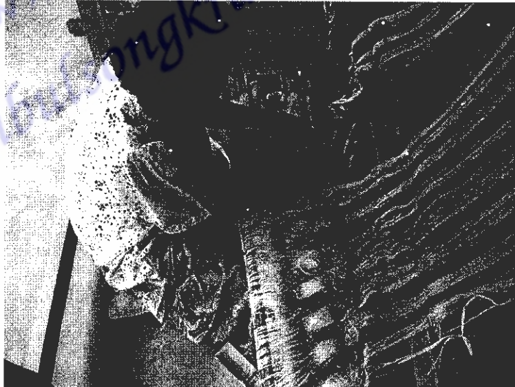
ภาพที่ 12 การคั้นหูก