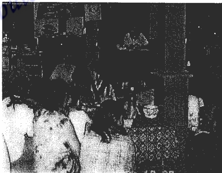
ภาพที่ 2 การสนทนาในประเด็นปัญหาและความต้องการเกี่ยวกับการพัฒนาผลิตภัณฑ์ของกลุ่ม