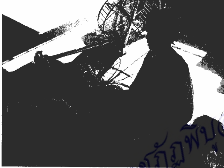
ภาพที่ 17 การปั่นฝ้ายให้เนื้อฝ้ายโปร่ง