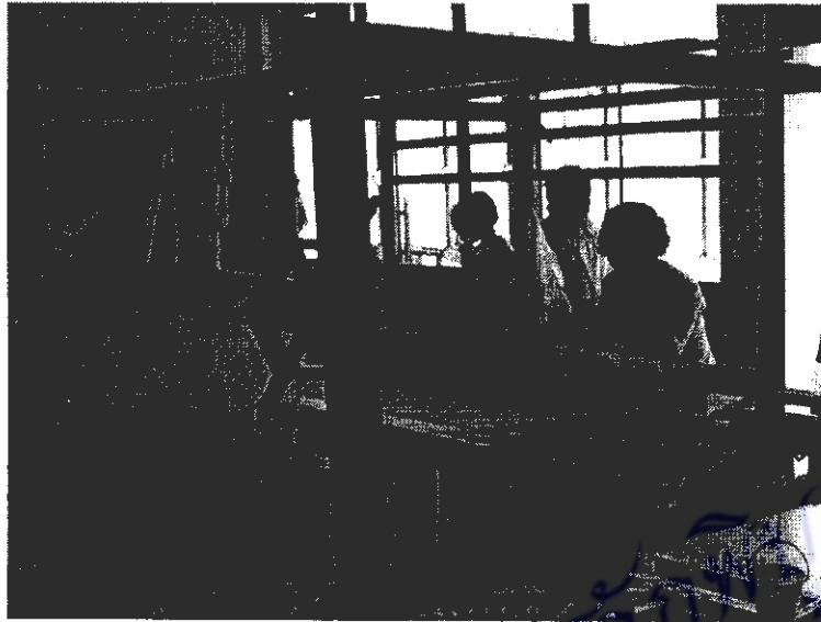
ภาพที่ 11 วิธีการทอผ้าบ้านน้ำพริก