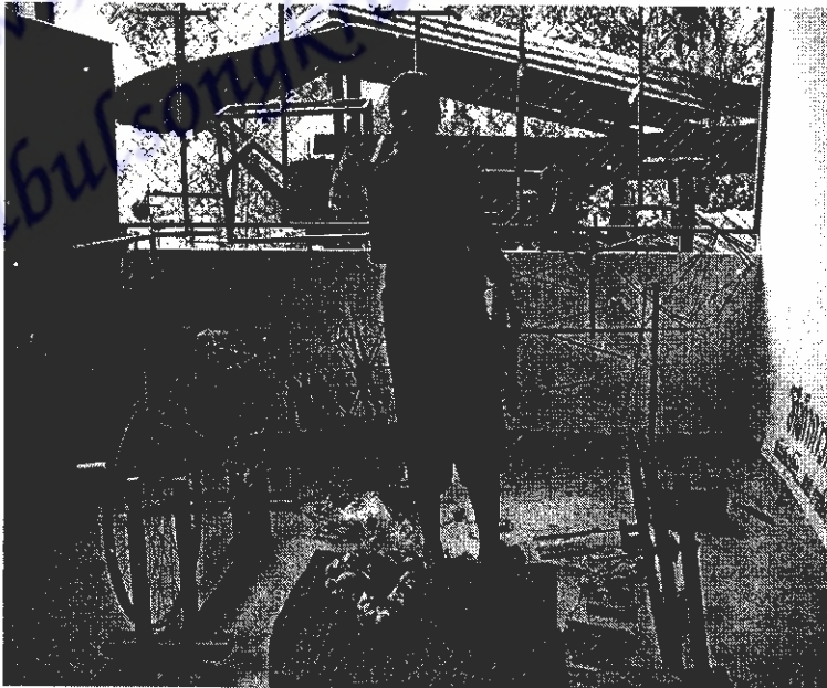
ภาพที่ 14 การเข็นฝ้ายใส่หลอด