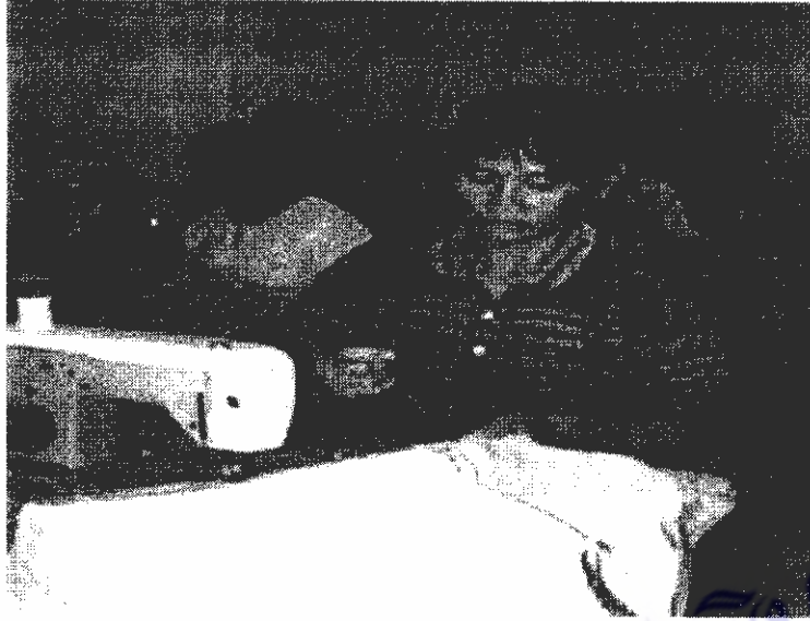
ภาพที่ 5 ฝึกปฏิบัติการออกแบบและตัดเย็บเสื้อผ้าสำเร็จรูป