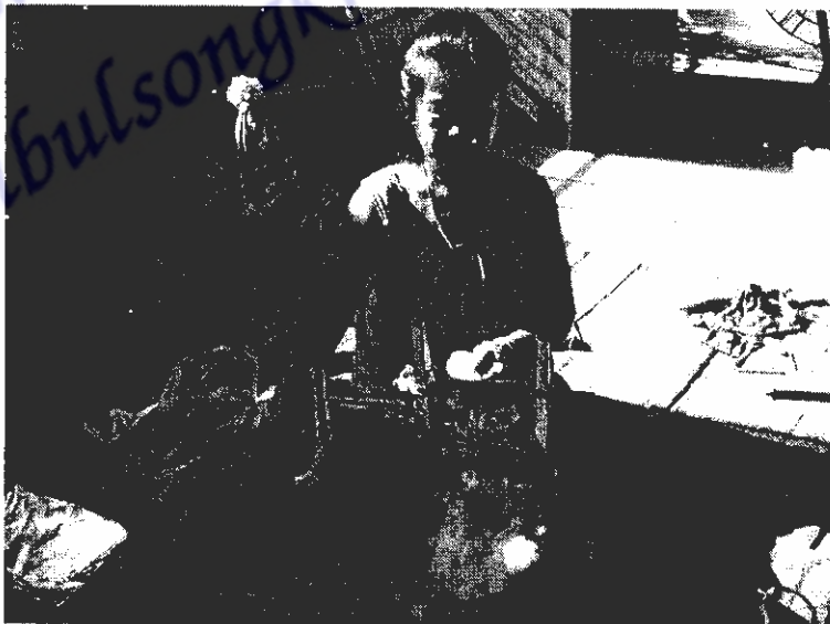
ภาพที่ 16 การฉีwf้ายเพื่อนำเอกเมล็ดออก