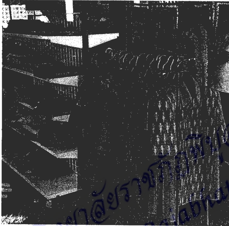
ภาพที่ 7 การนำผลิตภัณฑ์สำเร็จรูปสำหรับสุขภาพบุรุษไปออกจำหน่ายในงานประเพณีปักธงชัย