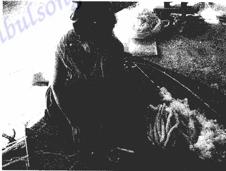
ภาพที่ 18 การล้อเนื้อฝ้ายให้เป็นลูกหลี