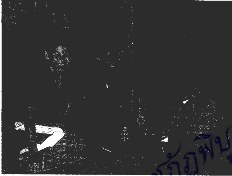
ภาพที่ 3 สัมภาษณ์สมาชิกกลุ่มเป็นรายบุคคล