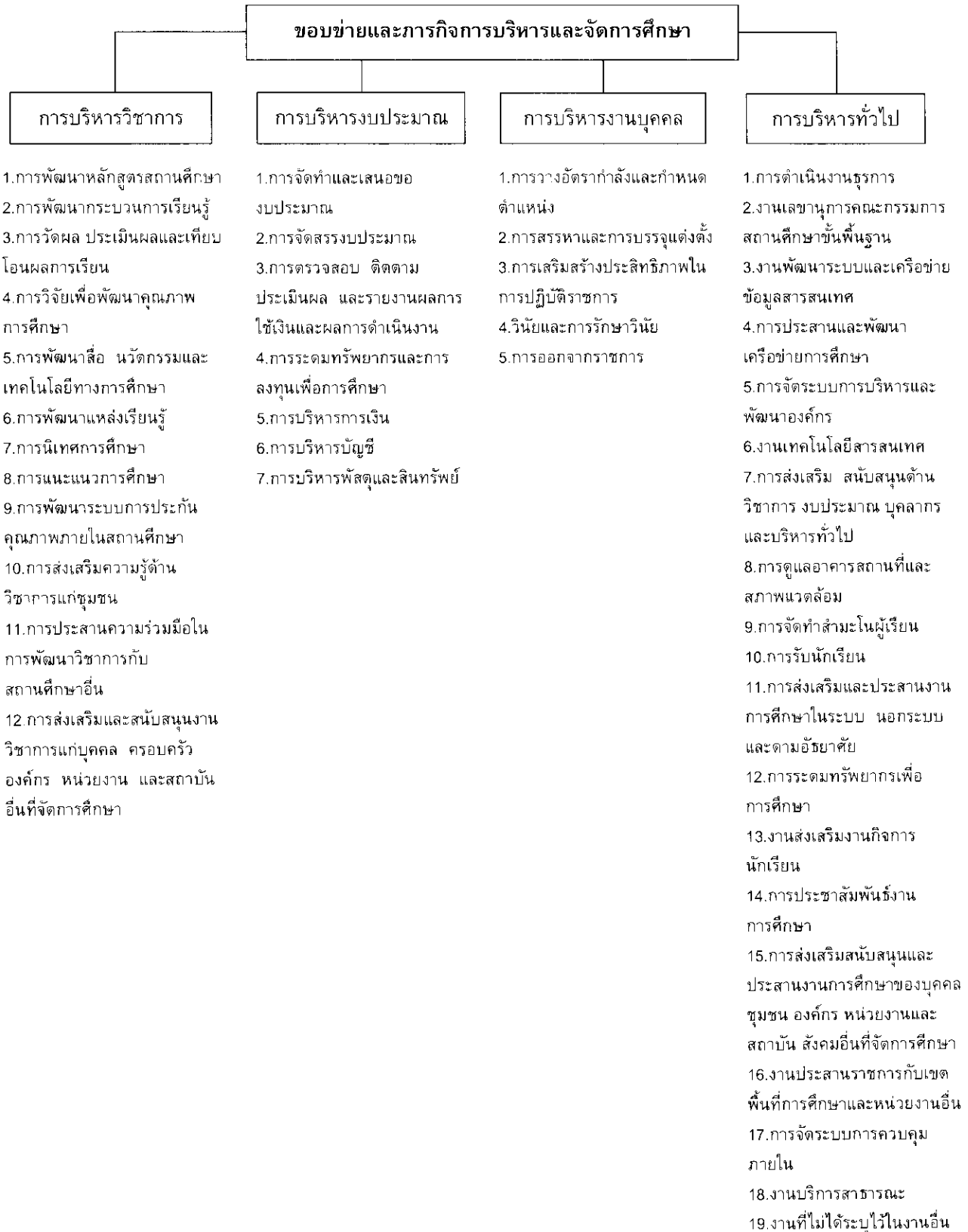
ภาพที่ 8 ขอบข่ายและภารกิจการบริหารและจัดการศึกษา